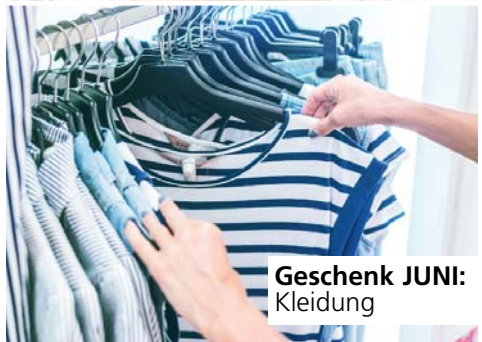
Geschenk JUNI: Kleidung