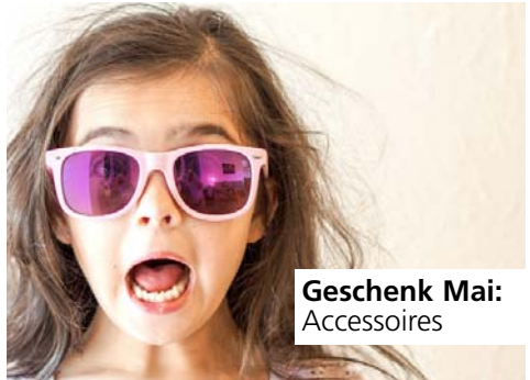
Geschenk Mai: Accessoires

gelegt werden. Was brauchen wir z. B. noch? Zahnbürsten und Zahncreme, Kosmetikartikel, kleine Spiele, Malblöcke und Hefte in DIN A5, Stifte, Mäppchen, Malkasten, Kuschtiere, Kleidung u.v.m. Wichtig ist, dass diese Geschenke wirklich neu sind. Lasst am besten die Verpackung und Schildchen dran. Das erleichtert den Mitarbeitern die Endkontrolle der Päckchen. Mit den Geldspenden, die ihr in die rote Box für die Packparty legt, kaufe ich über das Jahr verteilt besondere Angebote ein. Somit können die Kosten für die einzelnen Schuhkartons möglichst geringgehalten werden. Dankeschön auch dafür!